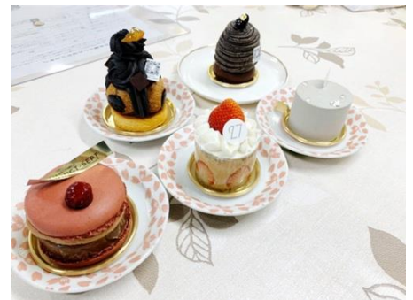
↑前はパティスリー27。じゃんけんで買った人から好きなものを選んだよね笑

みっぷすのホームページや校長ブログを見る場合、一番簡単なのは皆さんが登録しているLINEのトーク画面から進むのが一番簡単です。右の集合写真が写っているところをタップするとホームページが、笑顔の校長の写真をタップすると校長ブログが表示されます。校長ブログは毎日更新していて、楽しいですよ!